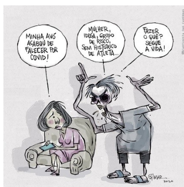
Figura 2: Charge (28)