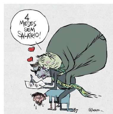
Figura 29: Charge (89)