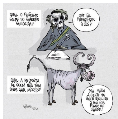
Figura 20: Charge (109)