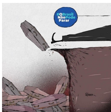
Figura 5: Charge (10)