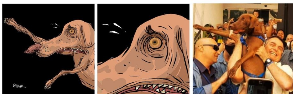
Figura 12: Tira (97)

As charges (65), (66) e (68) registram os números de mortos por Covid-19: na primeira (65), 30 mil mortos (o Coronavírus personificado concede uma medalha com uma caveira a Bolsonaro, que faz seu icônico gesto da “arminha” como comemoração); na segunda