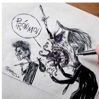
Figura 23: Charge (70)