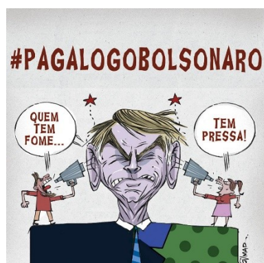
Figura 16: Charge (12)