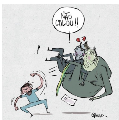
Figura 30: Charge (90)

No corpus analisado, é marcante a representação do Governo. Das 114 peças analisadas, 83 fazem referência direta ou indireta ao Governo, sendo que 50 ocorrências são da figura explícita do presidente, 13 são de apoiadores do Governo (incluindo um frango no