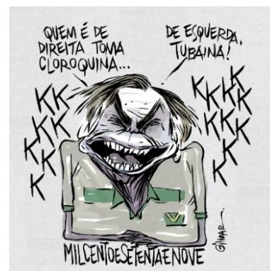
Figura 15: Charge (68)

Esses exemplos, além de registrar os números de mortos, registram também a postura de descaso do presidente Jair Bolsonaro em relação às vítimas da pandemia e do abandono do Governo.