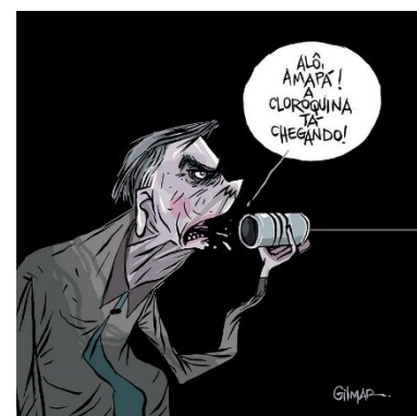
Figura 21: Charge (112)

São exemplos de estratégias necropolíticas: revogação de certas leis de trânsito (como a obrigatoriedade do uso de cinto de segurança); liberação maciça de agrotóxicos nas plantações de alimento; congelamento do salário mínimo; aumento do tempo e/ou contribuição para aposentadoria; privatização de serviços essenciais, para que a população “indesejável” não possa pagar; cortes de investimento nas carreiras públicas que visam proteção ambiental, bem como revogação de leis que protegem esses agentes; liberação de porte/posse de armas sem avaliação dos riscos; cortes no fornecimento gratuito de medicamentos nas farmácias populares, bem como o fechamento de algumas dessas farmácias.