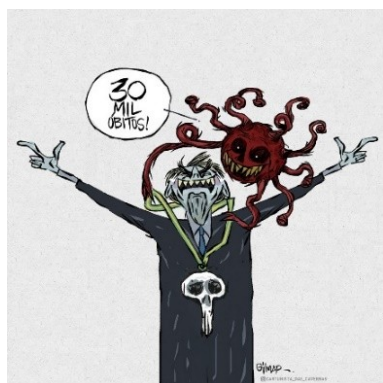
Figura 13: Charge (65)

(66), 80 mil mortos (o número “8” representando o símbolo do infinito, com um profissional cavando covas infinitamente; e o número “0” se assemelhando a uma esteira para roedores, com Bolsonaro correndo fatigado com uma caixa de Cloroquina nas mãos – talvez uma tentativa desesperada de vender o estoque absurdo acumulado pelo Governo como forma de combater o vírus, a despeito dos estudos científicos sobre a ineficácia do medicamento nessa empreitada. E, por fim, a terceira (68), com 1179 mortos, faz referência ao episódio em que Bolsonaro fez um trocadilho com Cloroquina/Tubaína. Circulou nas mídias que tubaína não seria alusão ao refrigerante, mas sim a um método de tortura usado na Ditadura Militar.