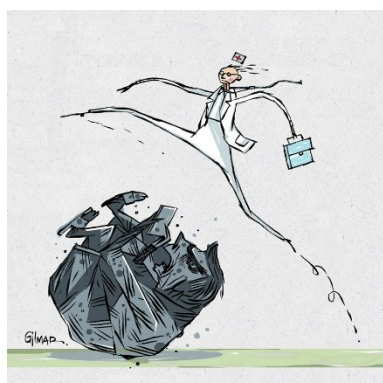
Figura 4: Charge (06)

Os outros elementos não explícitos, mas pressupostos, sobre a pandemia se repetem em outras charges, como em (6), com o profissional da Saúde saltando uma representação do presidente que parece uma pedra no caminho; (10), com um amontoado de caixões fechados e um balão de fala com o slogan “#OBrasilNãoPodeParar” que nega a quarentena como medida preventiva (mas que poderia ser usado em outras situações de comunicação); e (11), que traz a representação de Bolsonaro e Trump com máscaras nos olhos sobre uma pilha de caixões fechados.