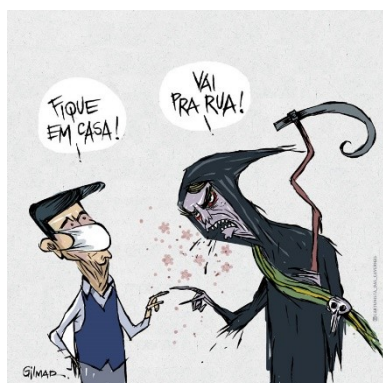
Figura 22: Charge (18)

O exercício do poder pelo poder visa minar quaisquer traços institucionais de democracia. O objetivo é a soberania do Estado e o total controle das potencialidades individuais (entendendo, aqui, que poder é diferente de potência). Isso significa que ao Estado soberano não interessa políticas razoáveis em prol da população. Isso é incorporado e refletido também nas relações entre Bolsonaro e seus ministros da Saúde, nas charges (18), (64) e (70).