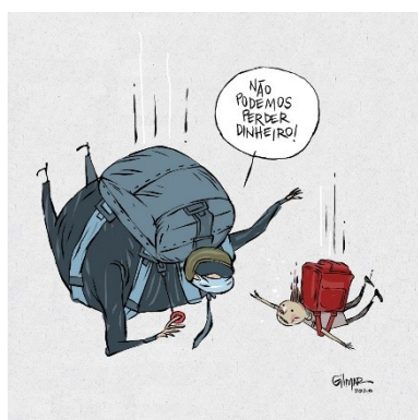
Figura 25: Charge (08)

para o cargo, como se vê na charge (64), o que gerou piadas de todos os tipos nas redes sociais. Apesar de a troca constante de ministros ter aparência de incompetência administrativa, pode-se notar uma postura utilitarista da pandemia por parte do Estado, postura essa alinhada aos interesses neoliberais, como é possível notar o registro, por exemplo, nas charges (08), (15), (16), (74), (89), (90), que retratam, de diferentes maneiras, as manobras do Governo para favorecer o setor empresarial, patronal, em detrimento do bem-estar da população.