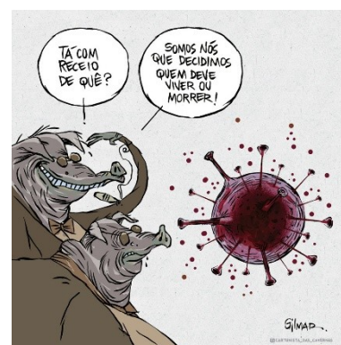
Figura 27: Charge (16)