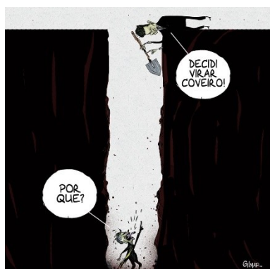
Figura 7: Charge (20)

impactam-se mutuamente, e, apesar da rede de notícias falsas pró-Bolsonaro, sua popularidade vem caindo até o momento – indo para o buraco .