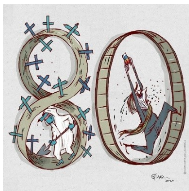
Figura 14: Charge (66)