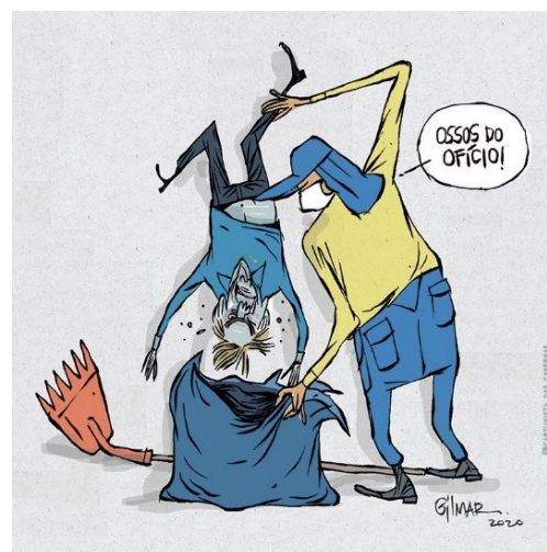
Figura 11: Charge (60)