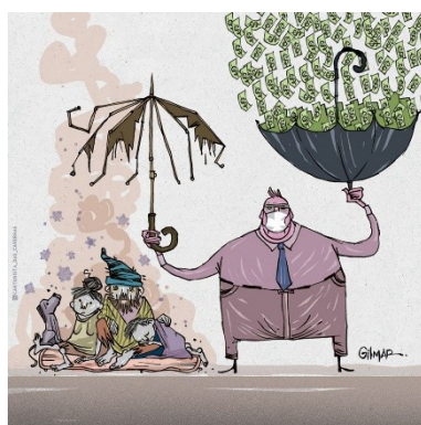
Figura 26: Charge (15)