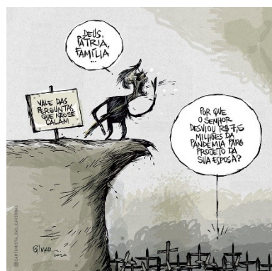
Figura 19: Charge (100)