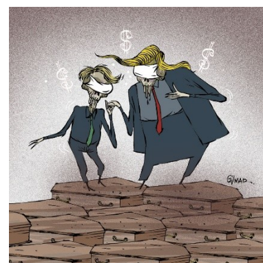
Figura 6: Charge (11)

O médico , o slogan e os caixões registram a pandemia de maneira pressuposta. São marcas textuais que poderiam se repetir em outros contextos, com outros significados. No entanto, devido à proximidade histórica, o leitor não tem dificuldade em resgatar a representação da pandemia nesses elementos. As retomadas desses ícones, dentro do quadro maior que compõe o corpus , permite-nos associar, por exemplo, o elemento explícito Vírus/Covid aos elementos retomáveis Caixões + Bolsonaro , que se tornarão elementos pressupostos, de modo que a iconografia analisada permaneça nas comutações Bolsonaro + Slogan + Médico + Caixões , mesmo quando não houver mais um elemento explícito, como se vê, a exemplo, na tabela: