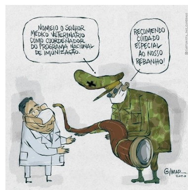
Figura 24: Charge (64)

Para o presidente, seus ministros, que declararam medidas racionais de combate à pandemia, estavam alinhados aos seus “opositores”, muitas vezes, fictícios (a ameaça comunista, por exemplo). O presidente chegou ao ponto de nomear um médico veterinário