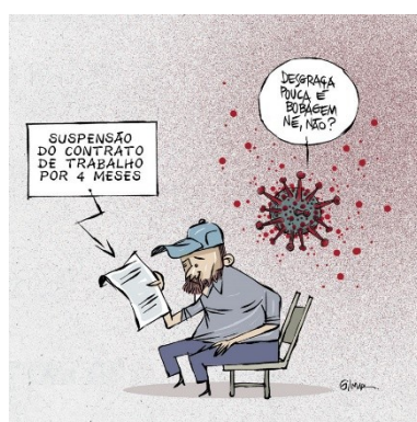
Figura 28: Charge (74)