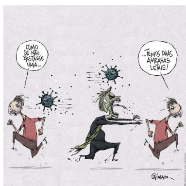
Figura 1: Charge (05)

A charge (05) traz uma representação icônica do vírus e do presidente Jair Bolsonaro como ameaças letais; a charge (28) explicita a pandemia com a palavra “covid” e traz outra representação de Bolsonaro e de sua esposa; por fim, a charge (34) traz representação icônica do vírus com uma pilha de caixões fechados.