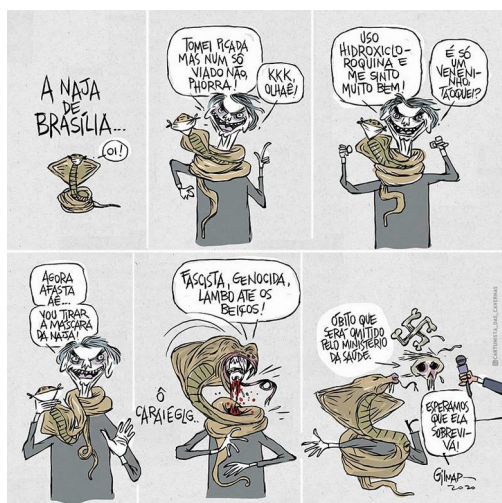
Figura 10: Tira (93)

e outras, não. Tal quantificação corrobora a imagem que Bolsonaro constrói de si nas mídias: de descaso para com as normas básicas de segurança mundialmente recomendadas. 7