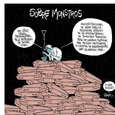
Figura 18: Charge (54)