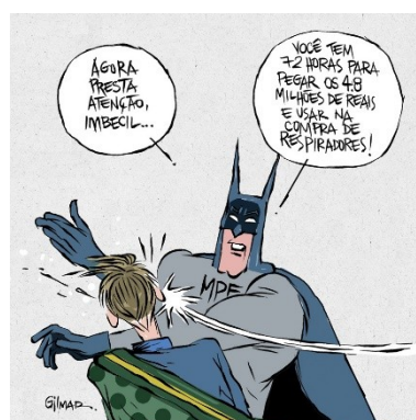
Figura 17: Charge (31)