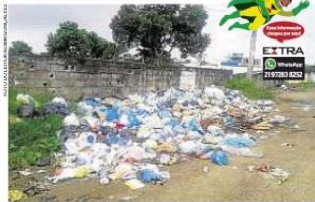
Muito lixo na Rua Mauá: o mau cheiro incomoda população

O nosso herói foi atrás de uma resposta da prefeitura. A Secretaria municipal de Serviços Públicos informou que em 48 horas uma equipe irá até o local para buscar uma solução para o problema dos moradores. 1