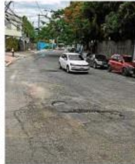
A Avenida Presidente Kennedy, em Nova Cidade, e a Rua Toledo Piza, em São Miguel