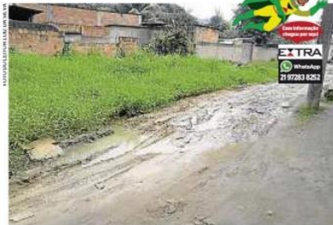
Rua Formosa, na Vila Pauline, atolada em lama e abandono

A Secretaria de Obras de Belford Roxo informou que uma equipe será enviada ao local, nos próximos dias, para verificar os problemas relatados pelos moradores e providenciar os reparos necessários para a via. ✕